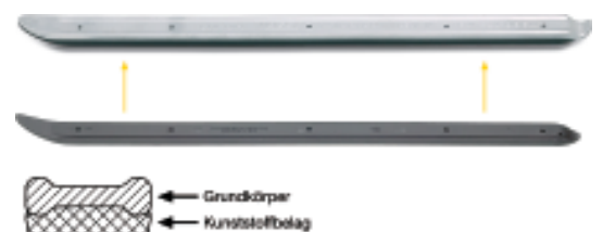
← Grundkörper ← Kunststoffbelag